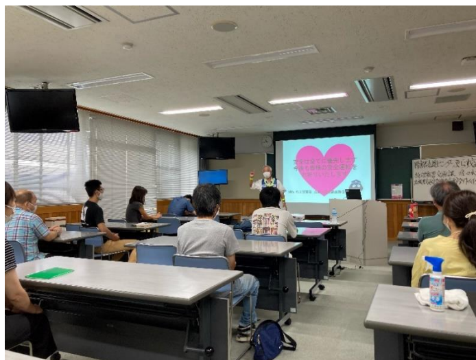
〈元警察官で安全協会の指導員さんの説明〉

松江警察署の方から交通ルールや交通事故を起こした時の対応について教えて頂きました。横断歩道を安全に渡るための確認方法を歩行者、運転者の両方の視点から学びました。疑似体験出来る機械を使ってゲーム感覚で楽しく学ぶことができました。