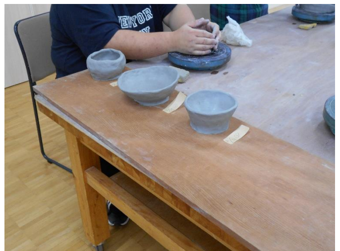
< 真剣そのものでした～ >