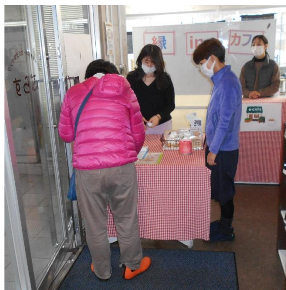
〈 ゲームやコミュニケーション 〉

午前、午後と2回に分けてカフェを開催しました。来所された方々同士で話をしたりゲームをしたりして楽しそうでした。ピアサポートの繋がりが広がっていくと良いですね。縁 ing カフェは申し込みが必要ないので気軽に参加してみてください。