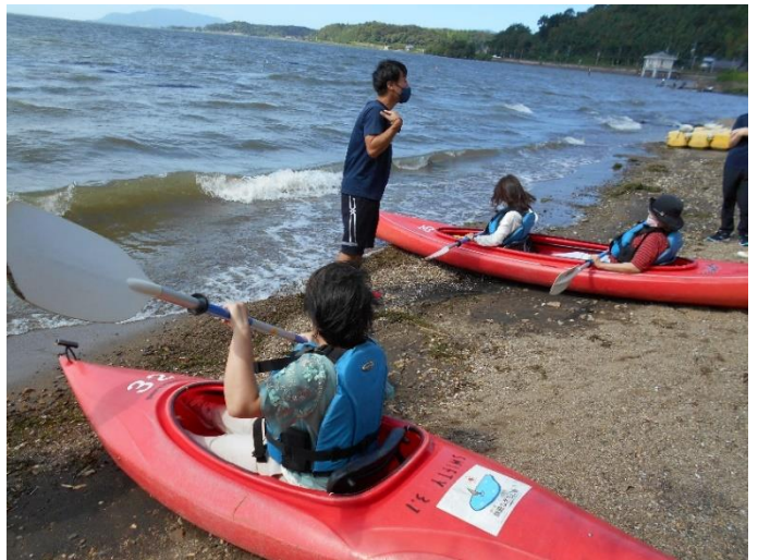
< インストラクターさんの説明 >