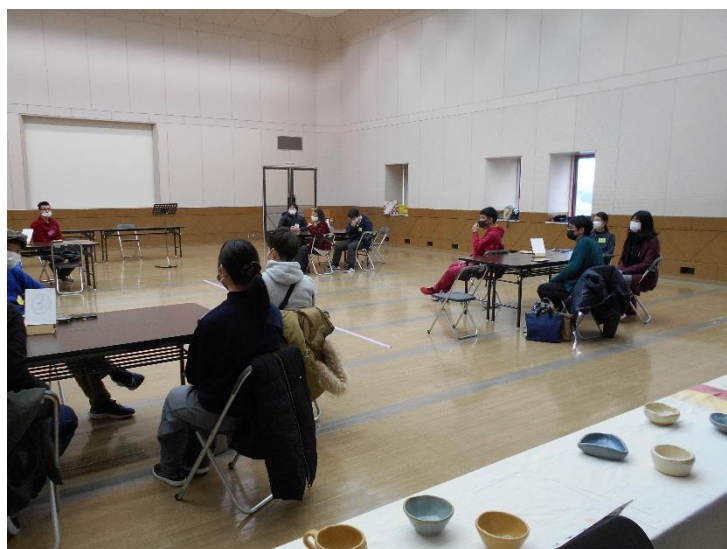
〈 自慢の特技や作品が披露されました 〉

陶芸作品、写真、サックス演奏、スクラッチアート、手芸など、参加者のみなさんの特技や趣味をご紹介いただきました。また、クイズ大会や、グループごとの交流タイムもありました。参加者の方からは、対面で話す機会は貴重なので良い時間になったと感想をいただきました。